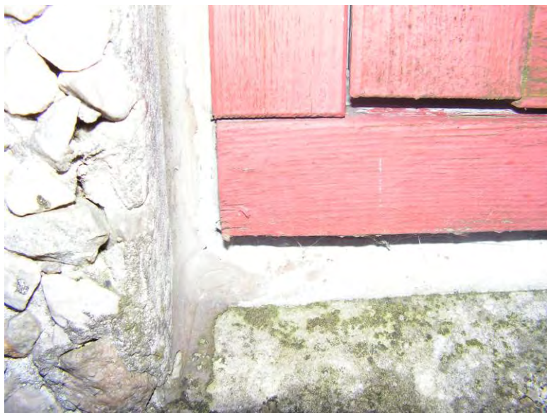
Foto: Eksempel på fugemasse anvendt omkring et vindue i en betonelementfacade.

Konstateres der PCB i fugemassen omkring en vinduesramme, er det sandsynligt, at PCB-en har spredt sig til såvel vinduesrammen som den tilgrænsende væg.