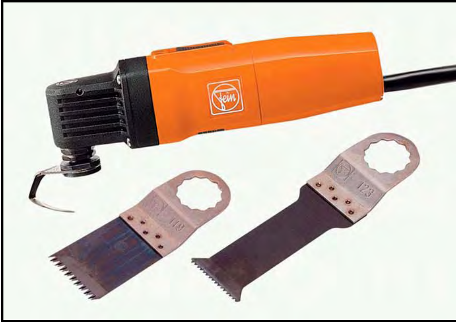
Foto: FEIN-skærer monteret med fugekniv velegnet til dybe fuger.

Er der tale om en facadefuge med et lavere indhold af PCB, og det konstateres, at PCB-en ikke har spredt sig til den omkringliggende mur, vil det normalt være nok at anvende let håndværktøj som for eksempel en el-kniv eller en rillefræser til at fjerne fugen.