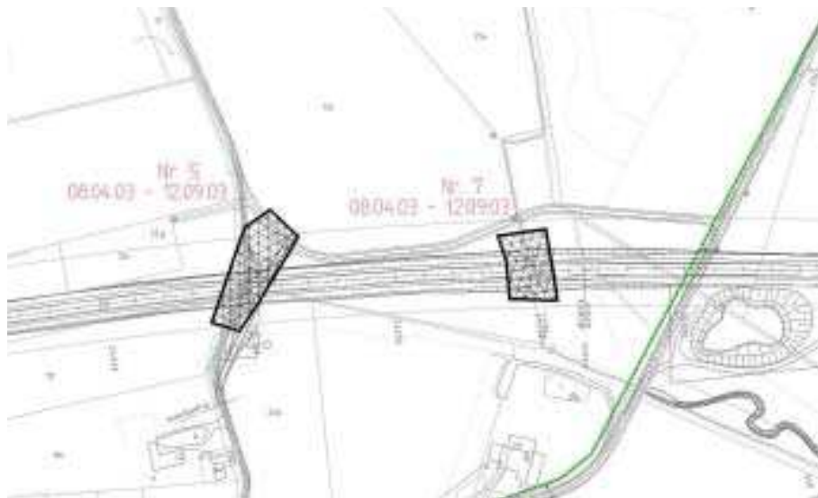
Figur 2. Et eksempel på en del af en oversigtsplan (bilag 0.1), der viser et fællesområde med nr. på området samt datoer for den periode, hvor området er fællesområde.

De 3 paradigmaer er samlet i ét hæfte og benævnt: "Vejle Amts paradigmaer for plan for sikkerhed og sundhed". Hæftet er i dag en fast del af udbudsmaterialet ved alle anlægsudbud i Vejvæsenet. Konceptets idé er, at de dokumenter, der omhandler det der er fælles i anlægsarbejdet (f.eks. fællesområder), har sikkerhedskoordinatoren ansvaret for, og ansvaret for de dokumenter, som er entreprisespeci-